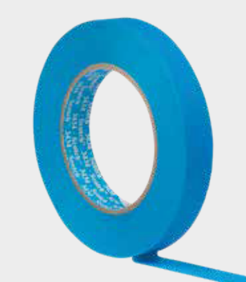
3M™ Scotch® Maskovací páska 3434