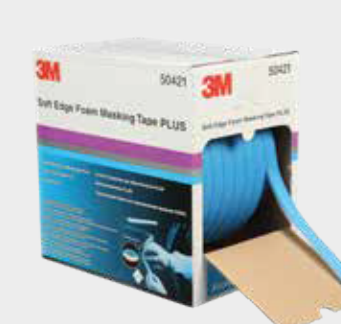
3M™ Pěnová maskovací páska PLUS s měkkým okrajem