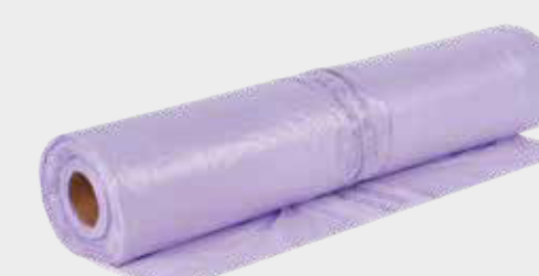
3M™ Fialová prémiová maskovací fólie PLUS 4 m x 150 m, 5 m x 120 m, 6 m x 120 m