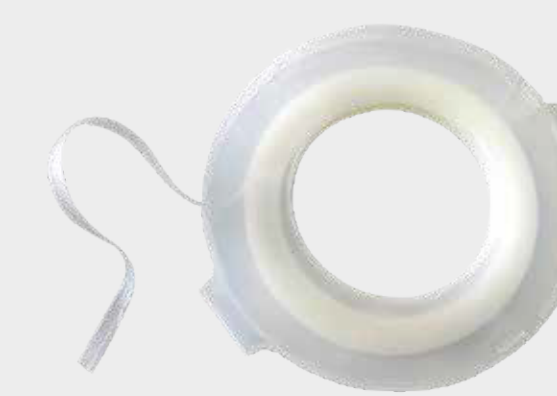
3M™ Jemná přechodová páska

Poznámka: Při maskování se vyvarujte vzniku ostrých okrajů. Ty způsobují viditelnost přechodu z důvodu koncentrace rozpouštědel na okrajích pásky.