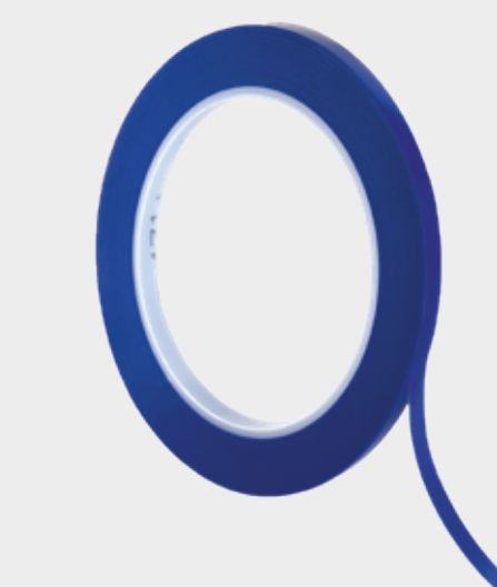
3M™ Konturovací maskovací pásky 471+