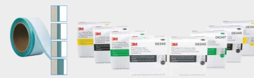
3M™ Lemovací maskovací páska