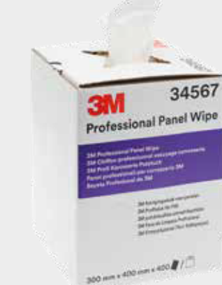
3M™ Profesionální utěrky na díly