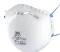
filtrační polomaska 8320