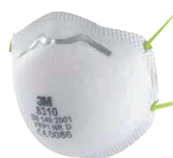
filtrační polomaska 8310