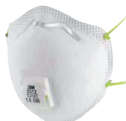
filtrační polomaska 8312