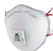
filtrační polomaska 8833