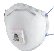
filtrační polomaska 8322