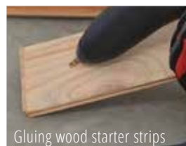
Gluing wood starter strips

Lepidlo Tackfix 48 má dobu otevření 40-50 sekund a poskytuje nejpevnější možný spoj. Lepidlo Tackfix 180 má dobrou počáteční pevnost a delší životnost s otevřenou dobou až 3 minuty, takže je ideální pro aplikace, kde je potřeba delšího času na nanesení lepidla nebo tam, kde je třeba na podlahu nanést lepidlo a ještě zapozicovat před vytvořením konečného spoje.