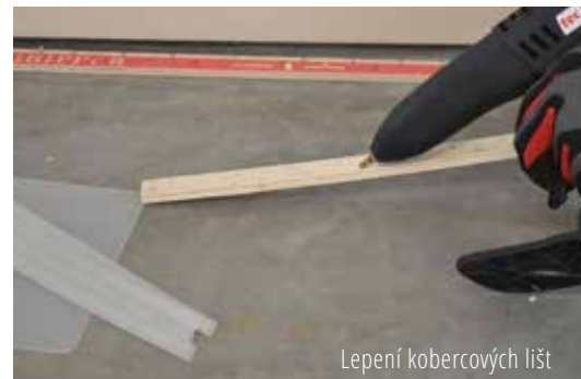
Lepení kobercových lišt

Montážní lepidlo Tackfix je rychlou a snadnou alternativou k přibíjení kobercových lepicích lišt, pokládání dlažby a startovacích lišt na dřevěné podlahy. Nabízí flexibilitu a zároveň i umožňuje krátkodobou změnu polohy podlahové krytiny, než dojde k trvalému spojení. Napněte koberec během několika minut, zajistíte dlaždice bez obav z pohybu nebo jednoduše použijte lepidlo jako další pár rukou při řadě podlahářských a stavebních aplikací.